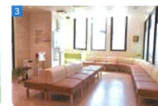
1 感染症対策もされており、安心感のある受付 2 患者との信頼関係を築くため、丁寧な診療を行う 3 待合室には外からの光が差し込み、温かみのある雰囲気