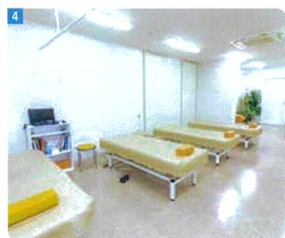
4 運動療法や薬物治療を中心に、リハビリテーションまで対応

し、即時に予約を取り予約票を発行。治療スピードの効率化を図り、患者の時間的負担を軽減する。 「痛いと思ったら我慢せず、コンビニエンスストアに行く感覚で来てほしいです」と話し、気軽に行ける地域のかかりつけ医として検査・診断から治療、手術、リハビリテーションまで一貫して手がける仕組みを整えている。 こまやかな感染症対策を行うことはもちろん、混み合いがちな時間の待ち時間を軽減するためウェーブ予約も可能にし、通いやすい体制を整えるなど、患者本位のサービスも重視している。